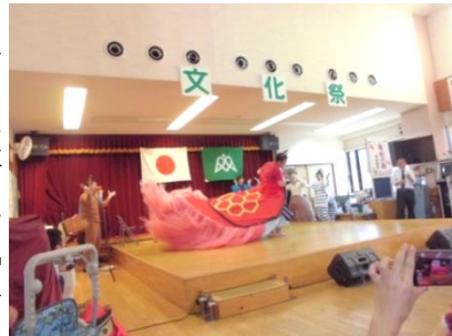
今年はいつもより多めに舞っていました！

さらに、デイサービス職員の「まつり」では、一糸乱れぬキレのいい踊りに、会場内の雰囲気は最高潮に達しました。