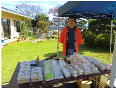
美味しいお菓子ありがとうございました

最後は全員で「里の秋」を合唱し平成最後の文化祭が終了しました。外では『焼き鳥』や『やきいも』『山本製菓』さんのぼたもち饅頭等の販売で来客者を喜ばせました。