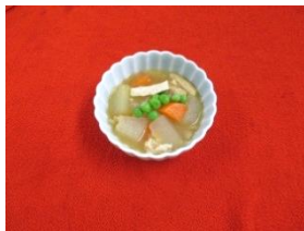
10月15日には煮物にいたしました。