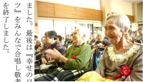
演芸会を楽しまれる利用者の皆さん！終始笑いが絶えませんでした！