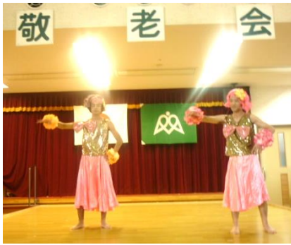
植原職員と苗床職員が女装しピンクディーを披露しました。

また施設長による『東京ブギウギ』や利用者の方々による『東京だよおっかさん』の替え歌で『振り込め詐欺だよ、おっかさん』も歌われ、会場が一体となって盛り上がり