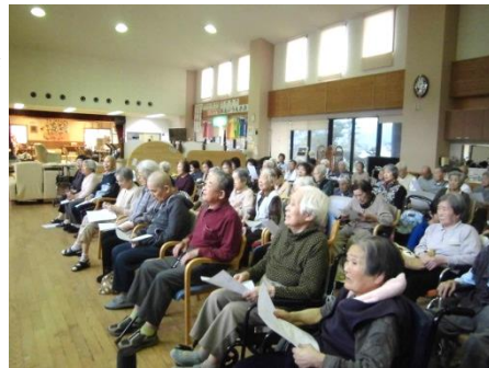
皆さん終始、演奏や歌を楽しまれました！