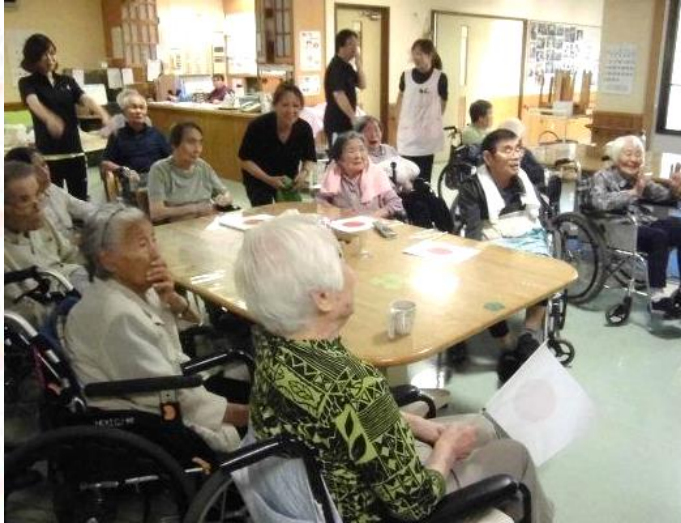
6回裏2点を加えて4対1となりました! 皆さん試合に集中されていました!

夏の甲子園に出場した『秀岳館』は18日、準々決勝で常総学院を4対1で破りベスト4入りを決めました。地元八代からの出場とあり利用者の方は一生懸命に応援されています。