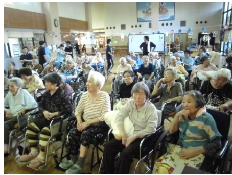
1階・2階利用者61名で参加しました！

」を利用者と一緒に歌い ました。利用者の皆さんには 鈴をもってもらい曲に合わ せて振っていたいただきました