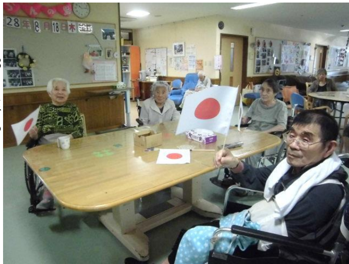
国旗をもち頑張ってる日本選手団を応援される皆さん!

8月18日に行われた秀岳館の試合のあとは、リオオリンピックの卓球男子決勝を観戦しました。利用者の方は手作りの国旗を片手に、応援されました。日本が決勝まで行き銀メダルを獲得した事は初めてであり利用者・職員ともに興奮していました。また皆さんでたくさんの種目を応援しましょうね。4年後の東京オリンピックが楽しみです。