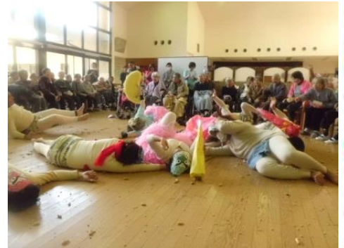
豆をあてられ最後は降参!!