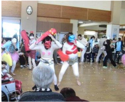
容赦ない豆にひるむ鬼たち!

2月3日(水)午後から、今年も邪気を祓い健康に過ごしていただくためにデイサービス利用者として入所者と合同で豆まきを行いました。皆さんで輪を作り、手に豆を握り、また美味しそうに豆を食べながら鬼の登場を待っていました。