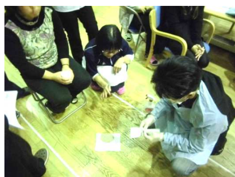
実際に処理行う杉野職員！初めての演習で緊張しました！