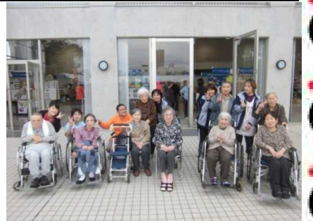
参加者で記念撮影！気候もとてもよかったです！

最後は中庭で記念撮影し楽しい思い出となりました。来年も利用者の皆さんと一緒に素敵な作品を作りたいです。