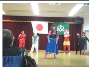
『キャラクターショー』