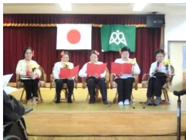
デイサービス利用者による合唱！

午後からはデイサービス利用者有志が舞台に立ち、東京だよお母さんーの替え歌 振り込め詐欺だよお母さん」を見事なコーラスで歌い幕が開きました。デイサービスの利用者職員によるレク体操 達者でな」ではタオルを片手にホール一体となった体操が行われました。入所棟の職員による ひよっこ踊り」や 甲ヤラクターショー」また恒例となった 電