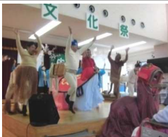
今年もずずらんの里で妙見祭を感じる事ができました！

大トリのデイサービス職員の日舞 まつり」では、最後の演芸らしく拍手喝さいで終わり平成27年度の文化祭も幕が閉じました。