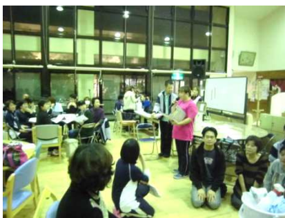
1階ホールでの研修風景