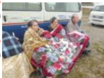
(防寒して見学される皆さん)

施設の入り口にも予防用具(マスク、消毒液など)を準備していますので来所の際にはご利用ください。