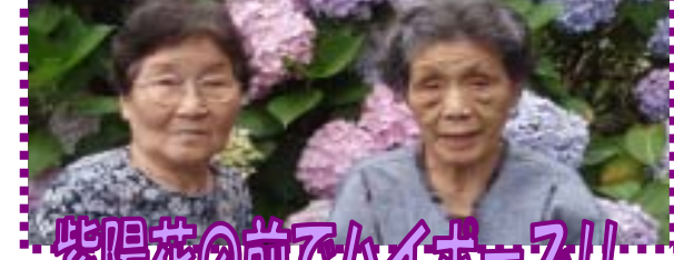
紫陽花の前でハイポーズ!!