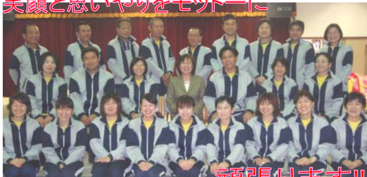
デイサービス職員一同