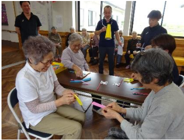
笑顔が絶えず、皆さん楽しまれていました。

競い合いました。獲物によって点数が違ったため、チームごとで大きく勝る中で釣りやすい獲物や竿の使い方等、要領が分かっていると、さらに競技は白熱し、皆さん夢中になって参加されていました。