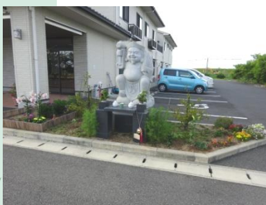
大黒様の周りを数種類の花が彩りました。

6月に入り、玄関東側の花壇であじさいが見頃となりました。同月12日のお散歩クラブでは、参加された皆さんにも美しく開花したあじさいを堪能していただきました。