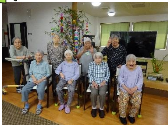
願いを込めて記念撮影 ☆三