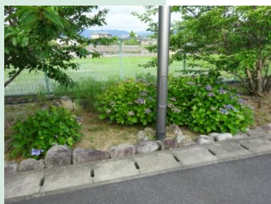
6月には季節を代表するあじさいが咲き誇りました。