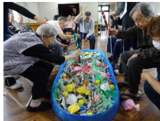
獲物を狙う眼差しが真剣でした。