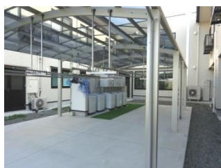
洗濯機が増え、干し場の十分なスペースが確保されました。