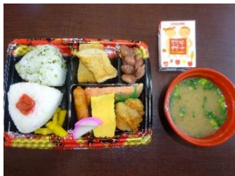
体を動かした後のお弁当の味は格別です♪

競技を終えた後は、得点の高かったチームから景品を選んでいただきました。昼食には手作り弁当が振る舞われ、皆さん舌鼓を打っておられました。