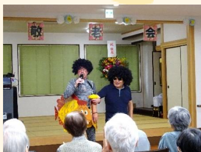
『およげ！たいやきくん』の替歌で子門真人兄弟が登場しました！

皆様のご長寿を心よりお祝い申し上げますとともに、これからもご壮健で心豊かな人生を過ごされますようご祈念申し上げます。