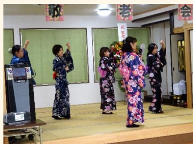
女性職員の華やかな浴衣姿がステージを彩りました♪