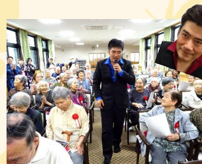
サプライズゲスト!?の登場で盛り上がりも最高潮☆