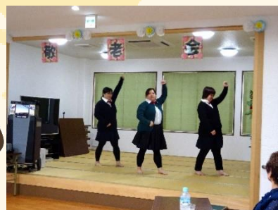
『樗（けやき）坂46』に扮し貫禄ある圧巻のダンスを披露♪