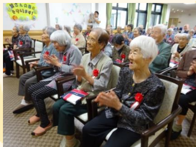
皆さんとても喜ばれていました♪