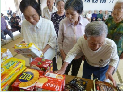
皆さん真剣に選ばれていました(^o^)