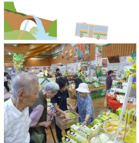
▲物産館にて品定め(*^_^*)

ポリウム満点の食事を堪能した後はいよいよ、国指定の重要文化財である通潤橋を見学！ 空中に巨大な弧を描き、石の組み合わせのなす造形美にみなさん目を奪われていました。通潤橋見学後は、道の駅の物産館で思い思いにお土産を購入し、楽しいひと時を過ごされていました。