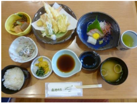
▲豪華てんぷら定食！ 衣のサクサク感もサイコーでした♪

まずは通潤橋見学の前に腹ごしらえ♪通潤橋のすぐそばの「通潤山荘」にて昼食をとり、山都町で採れる旬の食材を使用した「てんぷら定食」に舌鼓を打ちました☆自然豊かな山都町の景色を眺めながら食べる食事はまた格別でした♪