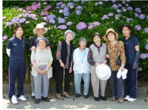
色鮮やかなあじさいに囲まれて

去る6月14日、県下有数の名所・宇土住吉公園にあじさい見学に出かけました。梅雨を忘れるほどの晴天の中、見事なあじさいが出迎えてくれました。ピンクや青、紫と濃淡が違い、葉の緑と相まって美しさがいつそう際立つあじさいの前に、暑さも忘れ「おかげで元気が出た。」と皆さん喜んでおられました。