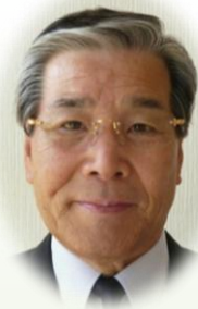
養護老人ホームすずらんの杜