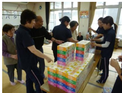
どれにしようかな…?