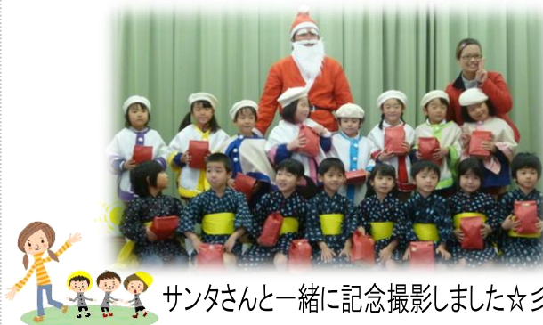
サンタさんと一緒に記念撮影しました☆

一生懸命で可愛い園児たちの発表を見ていると皆さん自然と笑顔がこぼれていました。立派な大人になってこれからの日本を支えてくださいね！