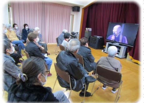
天台寺、瀬戸内寂聴権大僧正の 法話を拝見しました