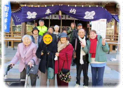
社殿の前でハイ、ポーズ☆ 全員が写真に写れるようにと 神主様が写真を撮って下さい ました！( ^ v ^ )