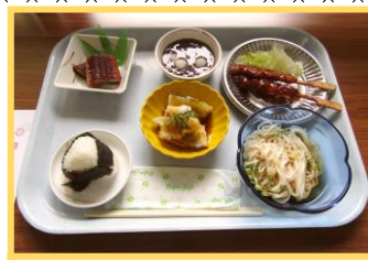
おにぎり・鰻の蒲焼 冷やしソーメン 焼き鳥・揚げ出し茄子 白玉ぜんざい・ラムネ

塩の効いたおむすびに冷たいそうめん。スタミナの源ウナギの蒲焼、ビールが飲みたくなりそうな焼鳥と揚げだしナス、デザートは冷やし白玉ぜんざいがお膳に並び、お飲み物は緑茶とラムネのお好きな方を選んでいただきました。 これから九月も残暑が厳しいかと思いますが、しっかり食べてこの夏を乗り越えましょう！