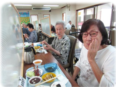
美味しくて ほっぺた落ちちゃうわ～