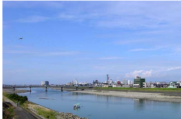
普段は美しい流れの球磨川ですが、令和二年の熊本豪雨はまだまだ生々しい記憶として県民の記憶に残っています。

いざとなったら三階まで避難するつもりです。三階までは階段が四十一段ー当苑には自転車漕ぎとペダル漕ぎを設置しています。皆さん、ぜひいざという時に備え、足腰の鍛錬の為に活用ください。