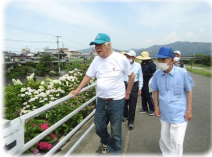
新たにハナミズキも植えられていました。4月頃花が咲き、秋には赤い実や紅葉が美しいそうです。また楽しみが増えました♪

暑い日が続いていたので花も元気がないかな?と心配していたのですが、前日に降った通り雨のおかげか生き生きとした花々が出迎えて、思った以上に鮮やかなあじさいの群生を眼前にして皆さんわあっと歓声をあげられました。 おなじみのピンクや水色や紫色に、ガクあじさい。