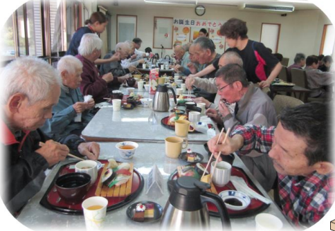
大好評 お寿司のおかわりが止まりません