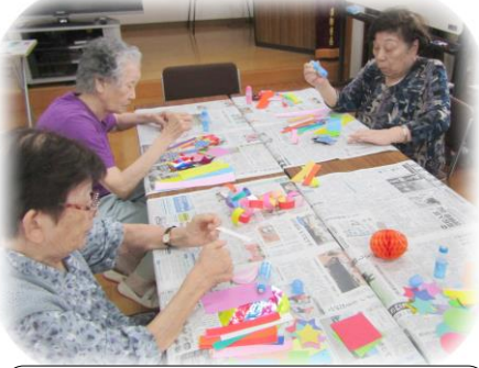
五節句の一つに数えられる七夕様 ひ孫も保育園で作ったかな～