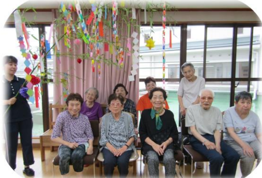
織姫様と彦星様が7月7日に お会いできますように…

くす玉、織姫、彦星、スイカ、天の川、星等々、思い思いの折り方で、工夫された七夕飾りが出来る度に、テーブルは華やかさを増していきます。