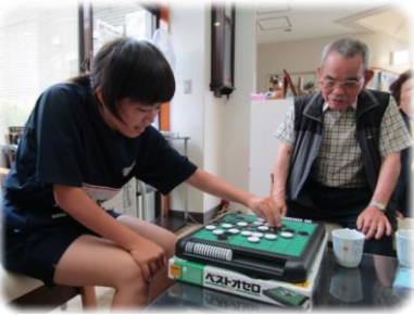
ムム！おぬしなかなかの腕前