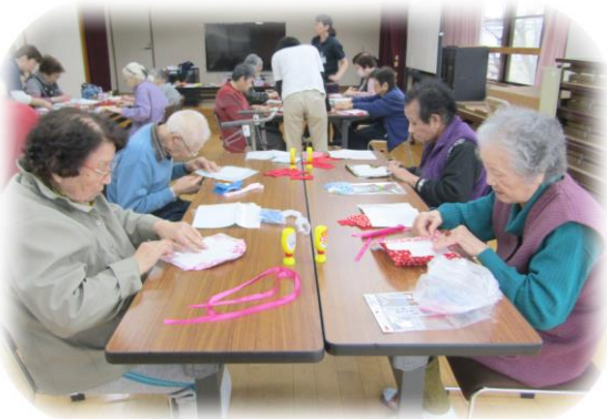
よか作品 作らんばん♡

り、リボンを留める場所が伝わりにくかったりで、「どこに付けるの〜？」説明しても「聞こえんバイ！」見本を見せると「こっちは見えんバイ（笑）」と蜂の巣をつついたような大騒ぎとなりました。てんやわんやではありませんでしたがなんとか完成までこぎつける