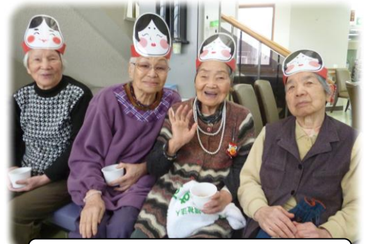
今年のすずらん苑福娘です

を食べられる方や、職員に「あなたも投げなっせ」と豆を分けてくださる方もおられ、寒い中での豆まきでしたが、歓喜に満ちた豆まきとなり、無事に鬼退治が出来ました。皆さんお疲れ様でした。