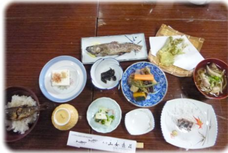
ヤマメ料理に大満足(*^_^*)