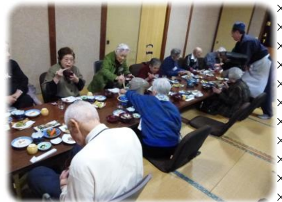
標高 730Mにある民宿 山女魚荘

「プの連続でしたが、今回は九州産交バスガイドさん付でプロならではの巧みな楽しい会話に引き込まれました。職員は、歴史の説明や案内の仕方の学習にもなりましたが、利用者の方々は