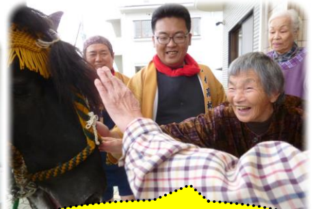
ごりやく ごりやく