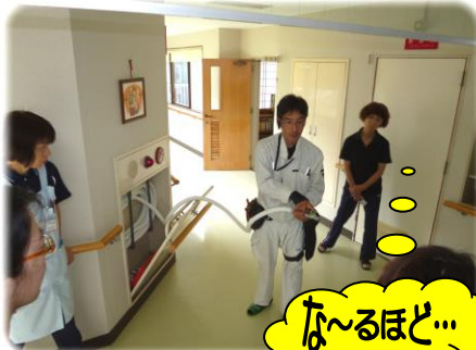
消火栓取扱い説明