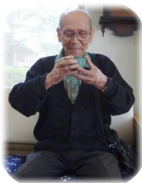
やさしい味に 酔ったばい...