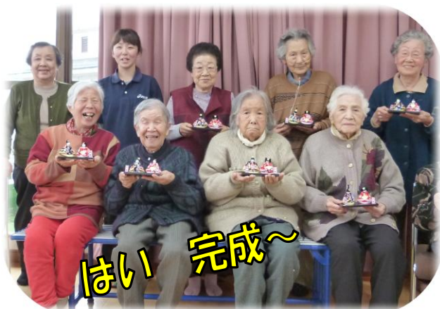
すずらん苑 おひな様