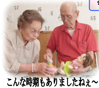
こんな時期もありましたねえ～