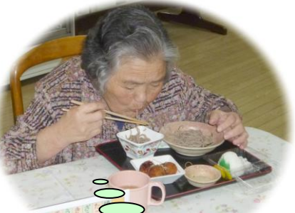
やっぱり蕎麦は喉ごしが一番!

今回は、やきとり・たこ焼き・うなぎの蒲焼・ギョーザ・ざるそば・きびなご天ぷらを用意しましたが、中でもうなぎの蒲焼が一番人気で「夏は、うなぎが一番いい。元気がでる!」と注文が殺到しました。 又、今年はソフトクリームが初登場し、フル回転で注文に追われる程でした。 今年の夏は、平和の祭典「ロンドン五輪」が開催されて