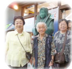
天草四郎さんに 恋心…