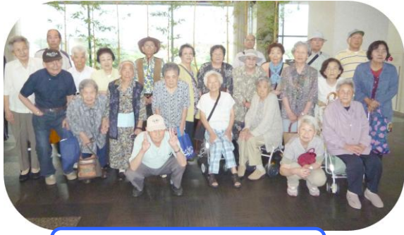
「天草観光ホテル岬亭」にて はいチーズ！

今回は、フェリーを利用して海を楽しみたいという事もあった二十五名の参加があり、天草松島を目指して八代港を出発しました。松島港まで五十分程揺れる船旅を満喫した一行は、海上から見上げる朱色の橋（5号橋）の雄大な美しさに感動しました。スワの船旅を楽しんだ一行は、もう一つの楽しみである昼食処を目指し、天草パールライン5号橋近くの「天草観光ホテル岬亭」