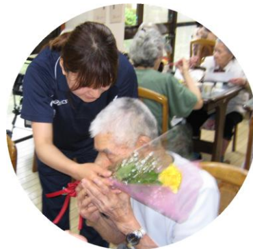
ありがとうございます!