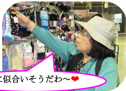
私に似合いそうだわ〜♥