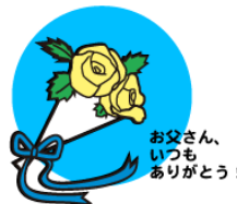
お父さん、いつもありがとうございます!