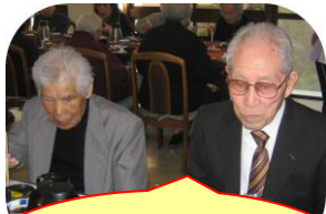
こりゃ美味ですなあ～